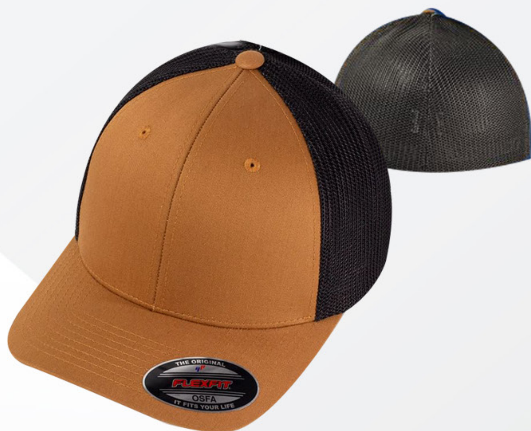
FLEXFIT OSFA MALLA