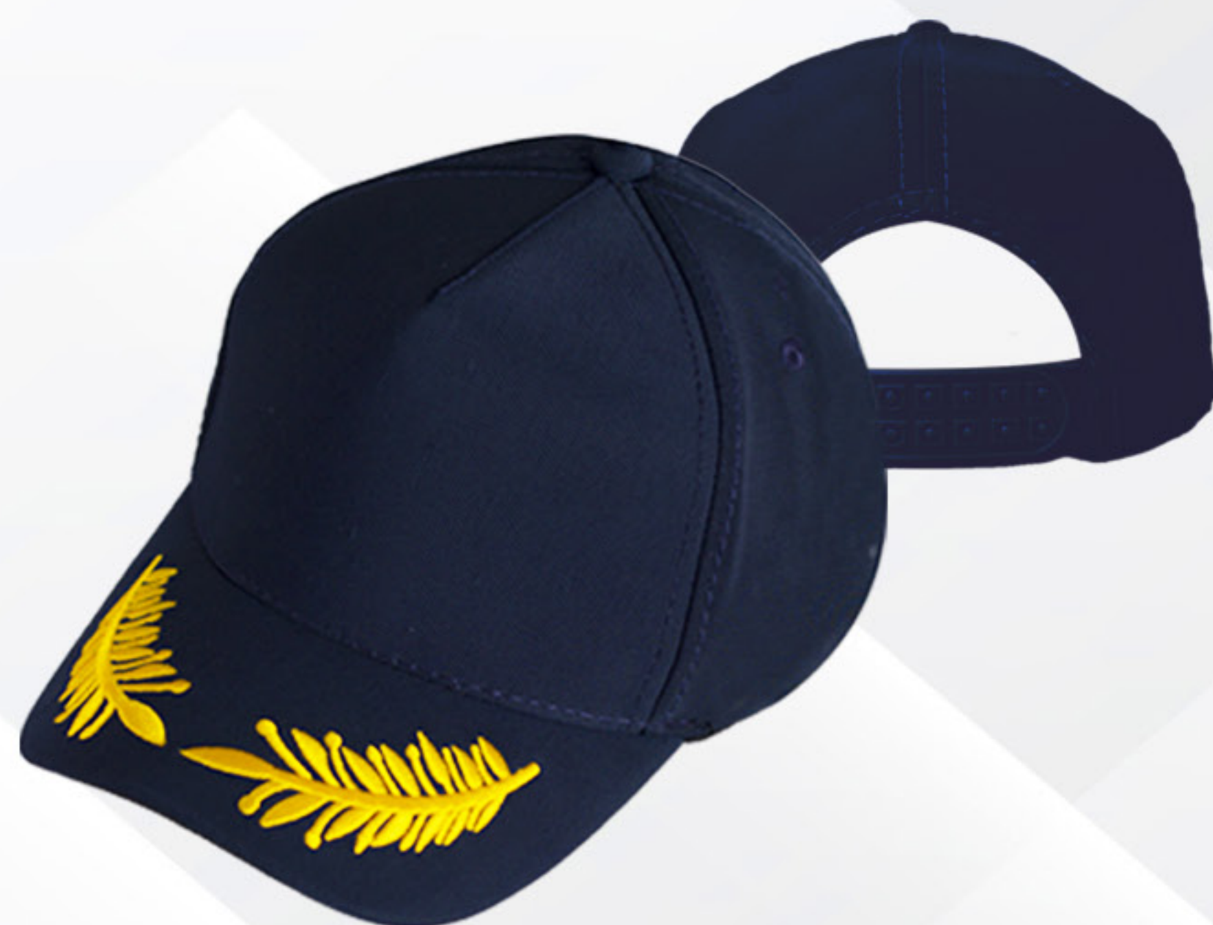
GORRA CON LAURELES