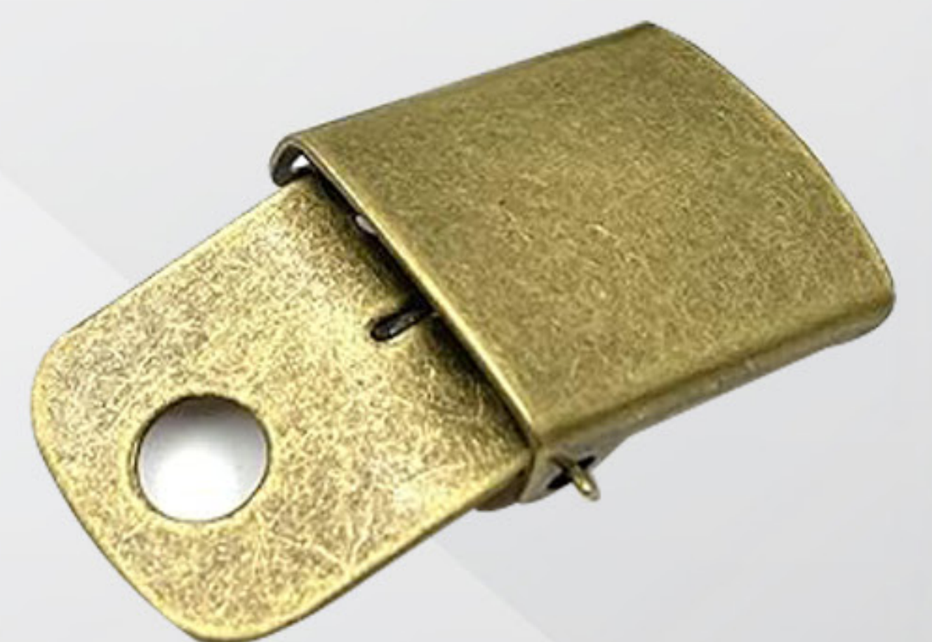
HEBILLA CIERRE CLICK