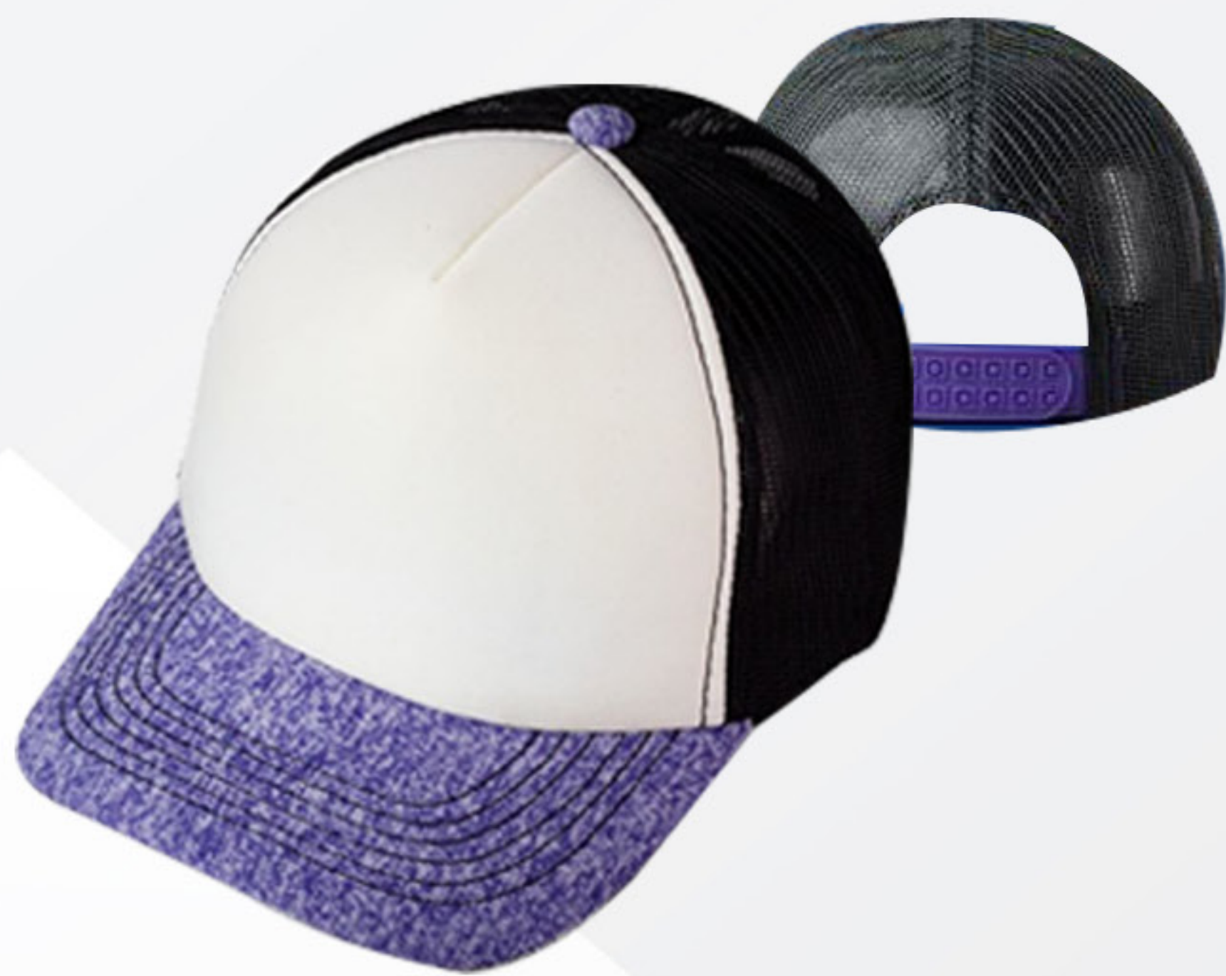
GOMA ESPUMA MALLA