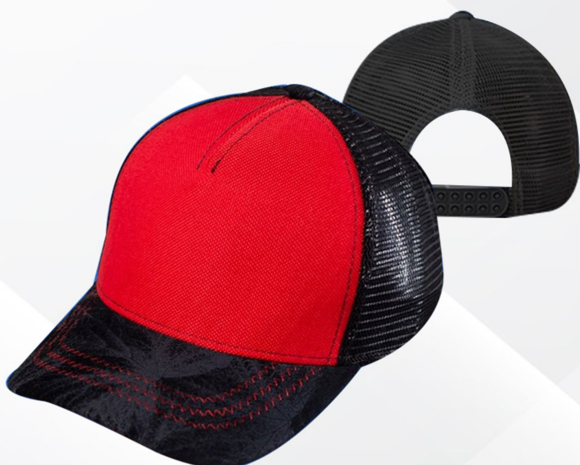
CURVA DE MALLA